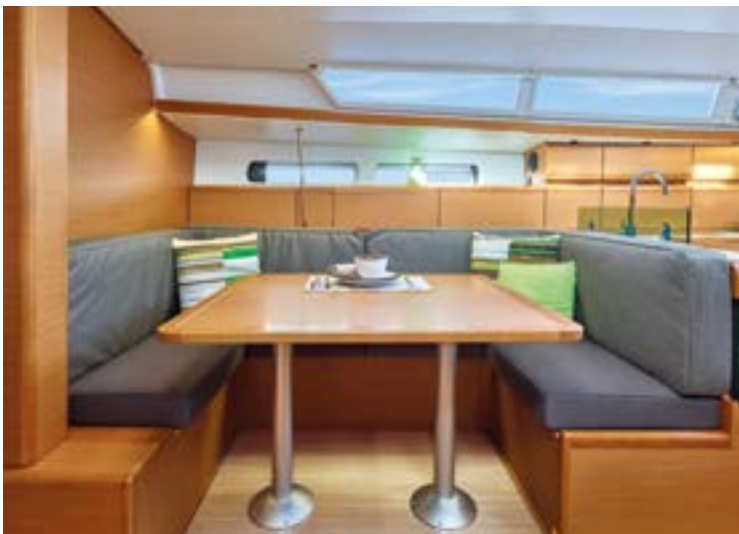
▲ U-shape saloon Grand carré en U Großer Salon in U-Form Gran salón en U Ampio quadrato a U