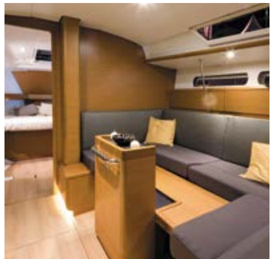
▲ Saloon transformable into berth Carré transformable en couchette Saloon umwandelbar in Schlafplatz Salón transformable en cama Quadrato trasformabile in cuccetta