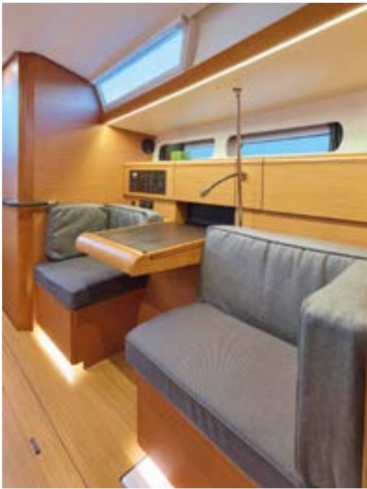
► Chart table looking forward Table à carte dans le sens de la marche Kartentisch nach vorne orientiert Mesa de cartas de navegación en el sentido de la marcha Tavolo da carteggio nel senso di marcia