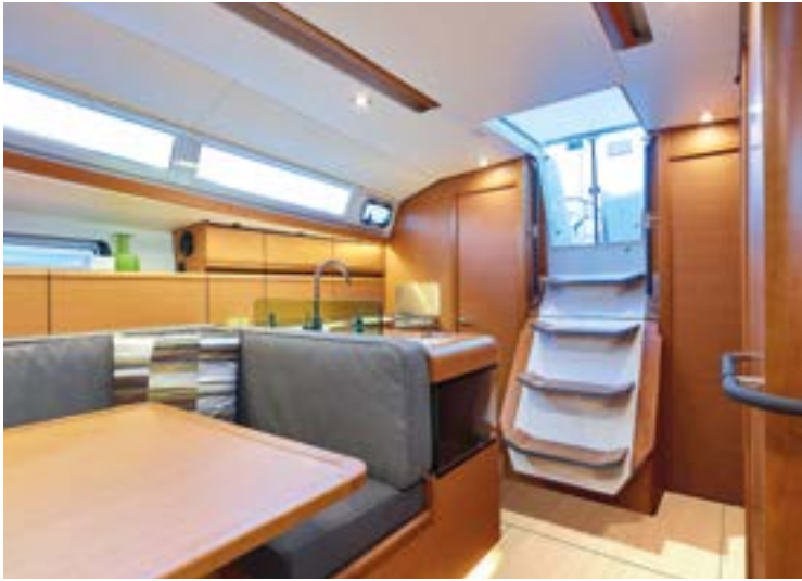
▲ A soft and secured companionway Une descente de cockpit douce et sécurisée Ein komfortabler und sicherer Cockpit-Niedergang Una escalera de cubierta suave y segura Scala di accesso al pozzetto comoda e sicura