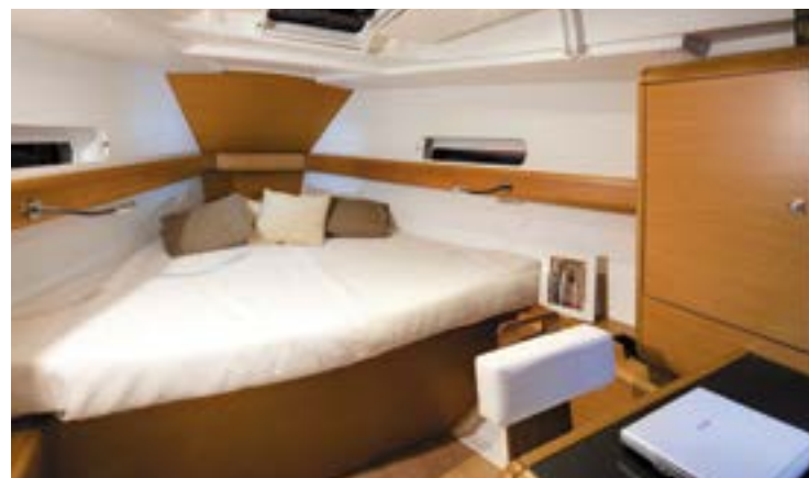
► Large forward cabine with desk Grande cabine avant avec bureau Grosse Forne Kabine with Schreibtisch Gran cabina de proa con despacho Grande cabina di prua con tavolino