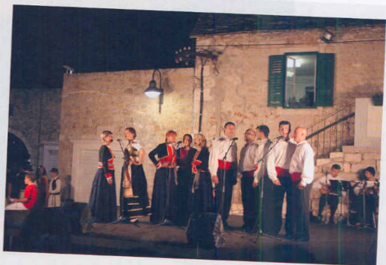
FREDAG AFTEN I PRIMOSTEN GAV DE LOKALE EN OPVISNING I DE LOKALE SANG OG DANSE TRADITIONER

Vi valgte den sydlige, men der var nu ikke nogen form for kontrol eller meldepost, som vi kunne melde os til ved indgangen. Da vi nærmede os de første af de gølge øer, som udgør nationalparken, aftog den kraftige vind, og det blev til en behagelig sejlad op langs vestsiden af den største af øerne, der har givet navn til hele nationalparken. Vi fandt en anløbsbro inde ved et lille hus, hvor vi indtog en meget sen morgenmad, inden vi besteg den nærmeste af de gølge bakker. Udsigten deroppefra var meget speciel. Lige så langt øjet rakte kunne vi se de ubevoksede og helt gølge øer spredt ud over den dalmatinske skærgård.