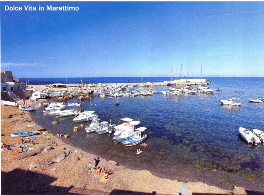
Dolce Vita in Marettimo