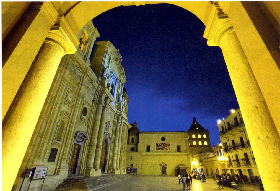
▲ Marsala, der „Hafen Allahs“. Mittelpunkt der Stadt ist die Piazza della Repubblica

Es gibt Tage, an denen lohnt es sich nicht aufzustehen und schon gar nicht auszulaufen. Heute ist so einer. Noch während wir am Frühstückstisch sitzen, wirft der Italiener neben uns seine Heckleinen los; eine englische Yacht nimmt sofort seinen Platz ein. Als wir uns von Ústica verabschieden wollen, hängt nicht nur der englische CQR, sondern auch das undefinierbare Eisen