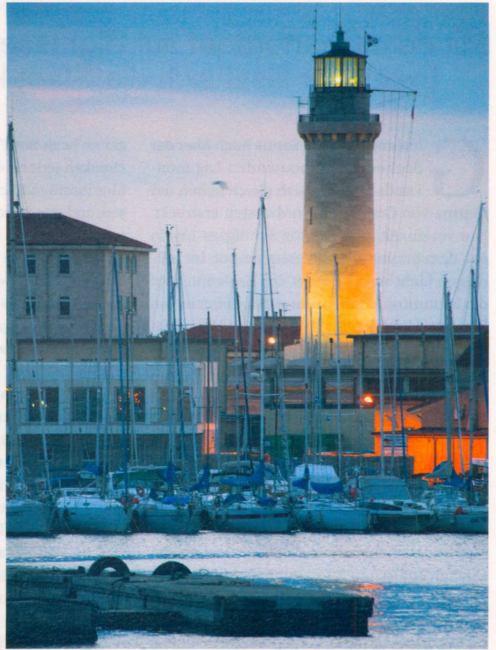
Ortsschilder in den Lagunen weisen den Weg. Triest ist neben Venedig die zweite wahrlich sehenswerte Metropole der Nordadria