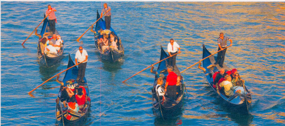
Die Charteryacht vor Novigrad – wer genügend Zeit hat, sollte den Abstecher nach Istrien einplanen. In Venedig lassen sich die Touristen über die Kanäle gondeln

fen erklären: „Die Gezeitenströme sorgen in der Lagune für ständige Bewegung. Die Fahrinnen müssen laufend gebaggert werden, sonst versanden sie. Es kann vorkommen, dass man mit den Arbeiten in Verzug ist.“ Erfahrungen wie diese soll die „Eos“-Crew noch des Öfteren machen. Und einmal sogar aufsitzen. Von daher dreht sie nun lieber bei und verzichtet schweren Herzens auf den weiteren Besuch des Naturschutzgebiets.