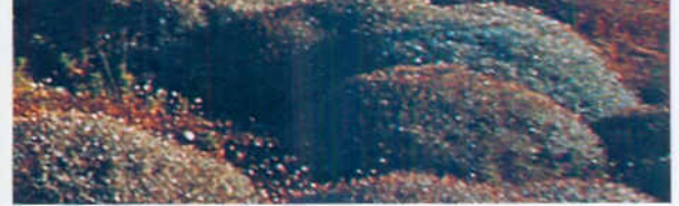
Die nach Süden offene Bucht Ormos Vasilikou. Einsam, sauber und idyllisch

Agamemnon Iphigenie den Göttern geopfert haben. Heute spannt sich eine Hängebrücke über das Ende der Bucht und verbindet Euböa mit dem Festland. Als wir unter ihr durch motoren, hoffe ich noch, dass sich seit ihrer Eröffnung die inhumanen Öffnungszeiten der Schiebebrücke über den Euripos Kanal in Chalkis geändert haben. Nachdem ich im Hafenamt die Gebühr für die Durchfahrt bezahlt habe, bin ich um eben diese Hoffnung ärmer: „Standby on channel 12 from 10 p.m. We will call you“, lautet der kurze Befehl.