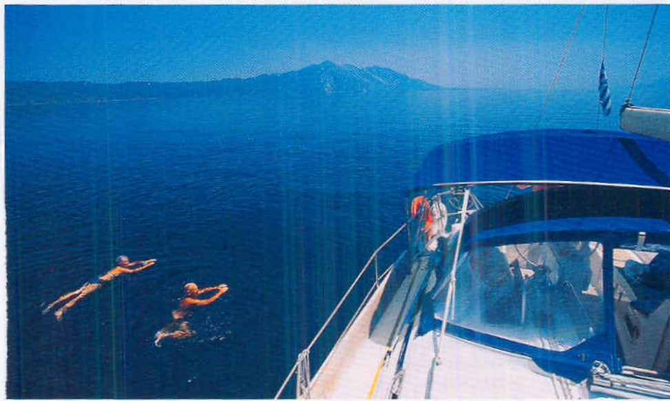
Oben: Wie ein „Binnensee“ Notio Evvoikos Kolpos. Unten: Nisos Megalo, Ormos Vasilikou – Euböa ist an Abwechslungsreichtum kaum zu übertreffen