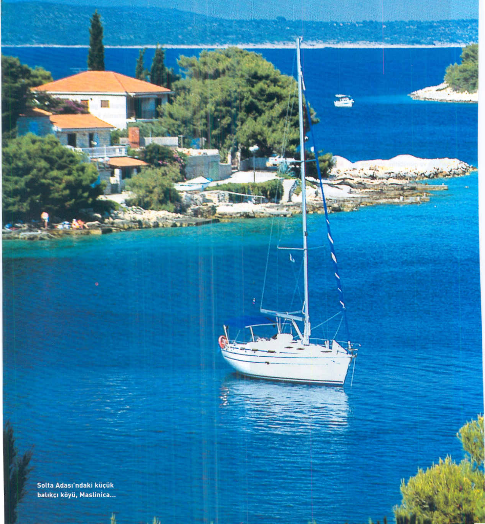
Solta Adası'ndaki küçük balıkçı köyü, Maslinica...