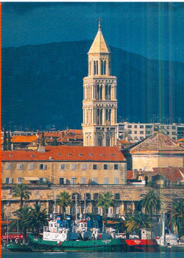
Ganz schön alt: Der 1700 Jahre alte Diokletian Palast in Split gehört zur UNESCO-„Liste der weltlichen Kulturerben“