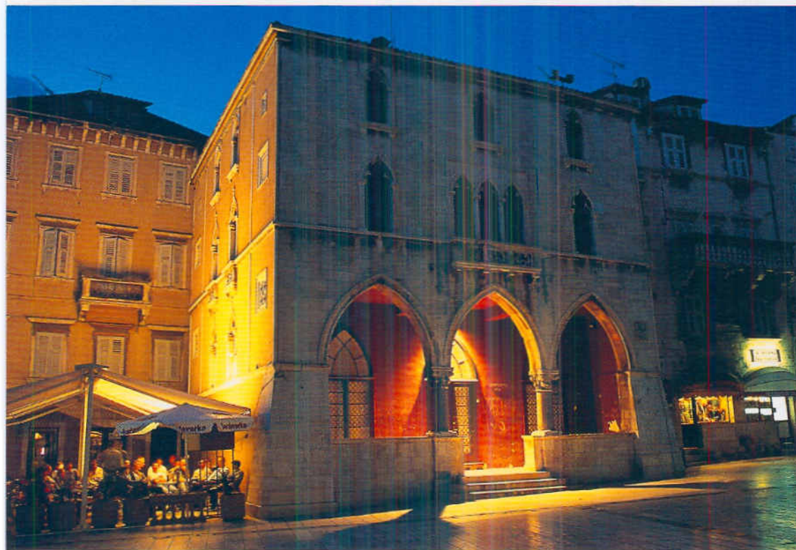
Einer von drei belebt-beliebten Plätzen Splits: Narodni Trg (Volkspplatz) mit dem alten Rathaus

flottem Galopp südwärts reiten, unserem heutigen Ziel Hvar entgegen.