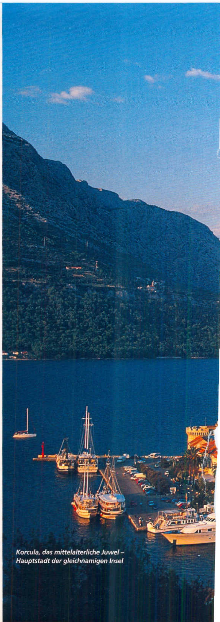
Korcula, das mittelalterliche Juwel – Hauptstadt der gleichnamigen Insel