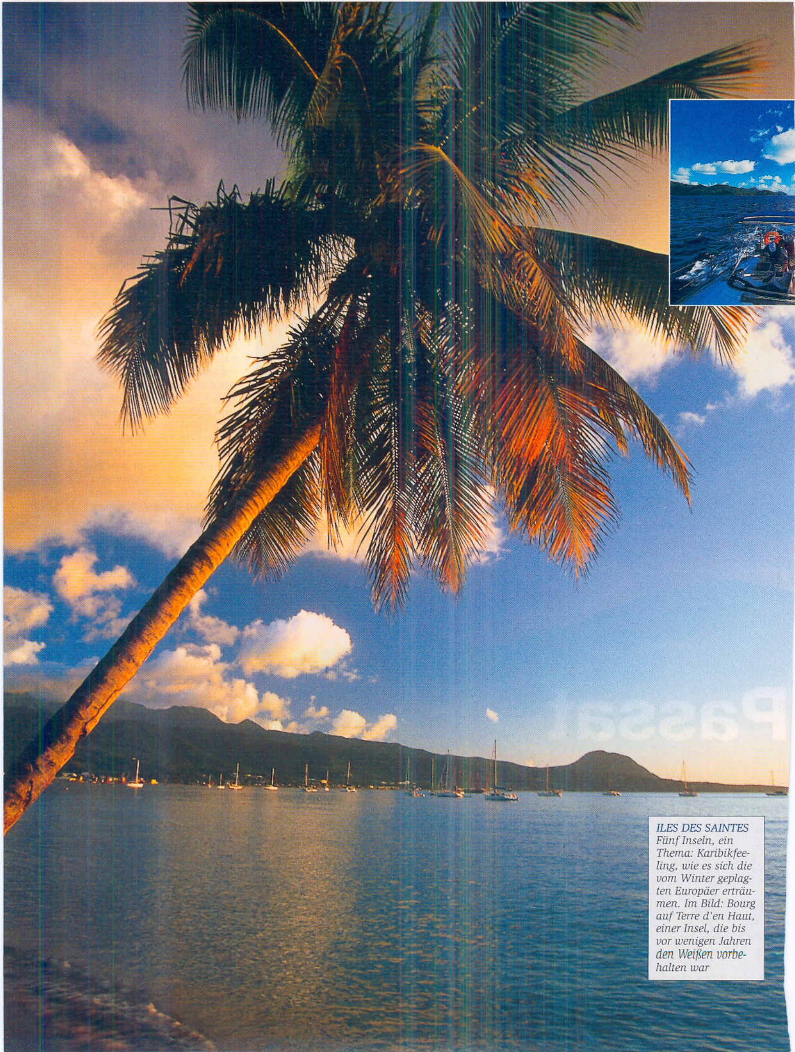
ILES DES SAINTES Fünf Inseln, ein Thema: Karibikfee- ling, wie es sich die vom Winter geplag- ten Europäer erträu- men. Im Bild: Bourg auf Terre d'en Haut, einer Insel, die bis vor wenigen Jahren den Weißen vorbe- halten war