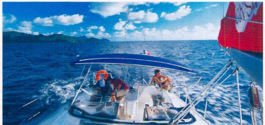
Martinique, vor der Anse Miton. Unterwegs mit einer komfortablen Gib' Sea 51

Die Gib' Sea 51 mit ihren 5 Kabinen, alle mit Dusche und WC, hätten auch einer Crew von 10 jede nur mögliche Privatsphäre geboten. Salon und Pantry lieferten den nötigen Komfort dazu und sorgten richtig dimensioniert dafür, dass es unter Deck nie eng wurde. Ausreichend Platz war auch im Cockpit. Das Deck war funktionell, die Deckbeschlüge waren übersichtlich angeordnet. Um eine Nummer größer hätten die Winschen sein können. Das hätte uns die Fronarbeit nach den Wendungen erleichtert. Eine Freude war es, die Gib' Sea 51 zu segeln. Das Rigg war solide, und so konnten wir das Schiff bei steifem Passat unter Vollzeug schon mal über seine Rumpfgeschwindigkeit hinaus bügeln oder härter als sonst vertretbar an den Wind legen. Simpel und effektiv war das Bindereff. Das Großstand damit wie ein Brett und zog gut. Mit seinen 100 PS war das Schiff auch ausreichend motorisiert. Mit der von der Charterfirma empfohlenen Drehzahl von 2200 UpM konnten wir bei Flaute zwar Meilen machen, nicht aber gegen den Wind anboxen. Dazu mussten wir den Motor schon auf 3000 UpM hochdrehen.