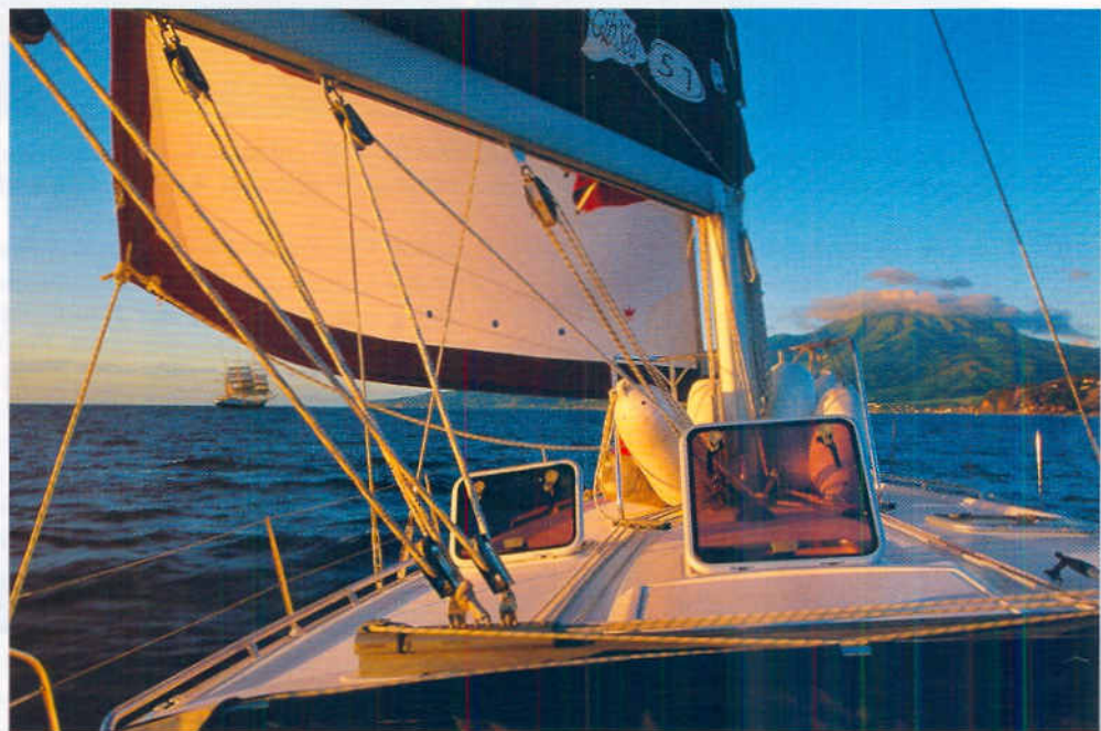
Martinique, auf dem Weg nach St. Pierre – Kulisse wie aus einem Abenteuerfilm

Als sich die Bucht von Fort de France an Steuerbord öffnet, kann sich der Passat ungehindert in die volle Segelgarderobe unseres Schiffes krallen und uns einen Segeltag wie aus dem Karibik-Bilderbuch bescheren. Zusammen mit der hinter den Horizont kippenden Sonne fällt unser Anker auf der Reede von St. Pierre, das bis zum 8. Mai 1902 Martiniques Metropole war. Am Morgen dieses Tages rülpste der Mt. Pelée. Ein Orkan aus explodierenden Gasen raste die Flanken des Vulkans hinab. In der Feuerwalze verglühte das Paris der Karibik und mit ihm starben 30 000 seiner Bewohner.