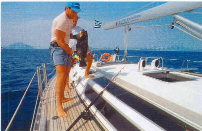
■ Jedrenje i ribolov - spoj dva iskonska gušta

njihovu nazočnost otkrit će vam jata galebova ili drugih morskih ptica koje se izdašno hrane obrušavajući se u često od količine ribe proključalo more - a svakako ćete se na pravomu mjestu zateći u trenutku kad se veliki grabežljivci agresivno ustreme na tu svoju marendu. Da ne biste doživjeli neugodna iznenađenja, primjerice prazan kalem multiplikatora s kojeg je, dok ste vi spavali, ribetine odmotala i otkinula sav najlon, dobro je postaviti neki sistem za dojavljivanje griza - tvornički indikator ili improvizirani, poput nekog lončića koji će se zakotrljati po cockpitu. A kad multiplikator zapjeva, štap u ruke i u boj! u boj! Ako ste sami na brodu, za takvu situaciju pripremite se i postavljanjem na dohvata ruke kuke ili podmetača - jasno, ako imate drugog člana posade, onda će prihvaćanje jednom dovučene ribe biti njegov (ili njezin!) posao. Naime, izbjite si iz glave iluziju da ćete i trupa dugokrilca teškog desetak kilograma štapom dići iz mora ili ga dovući u cockpit preko krmenog zrcala: tu pomaže samo dobro odmjereno hvatanje kukom ili jakim podmetačem. Ne zaboravite da ste na jedrilici, a ne na fishermanu, odnosno da je prostor za manevar ograničen i "posut" mnogim remetilačkim faktorima, pa se svladavanje tunice od 15 kilograma priborom od 20 funti može "izrodit" u lijepu avanturu.