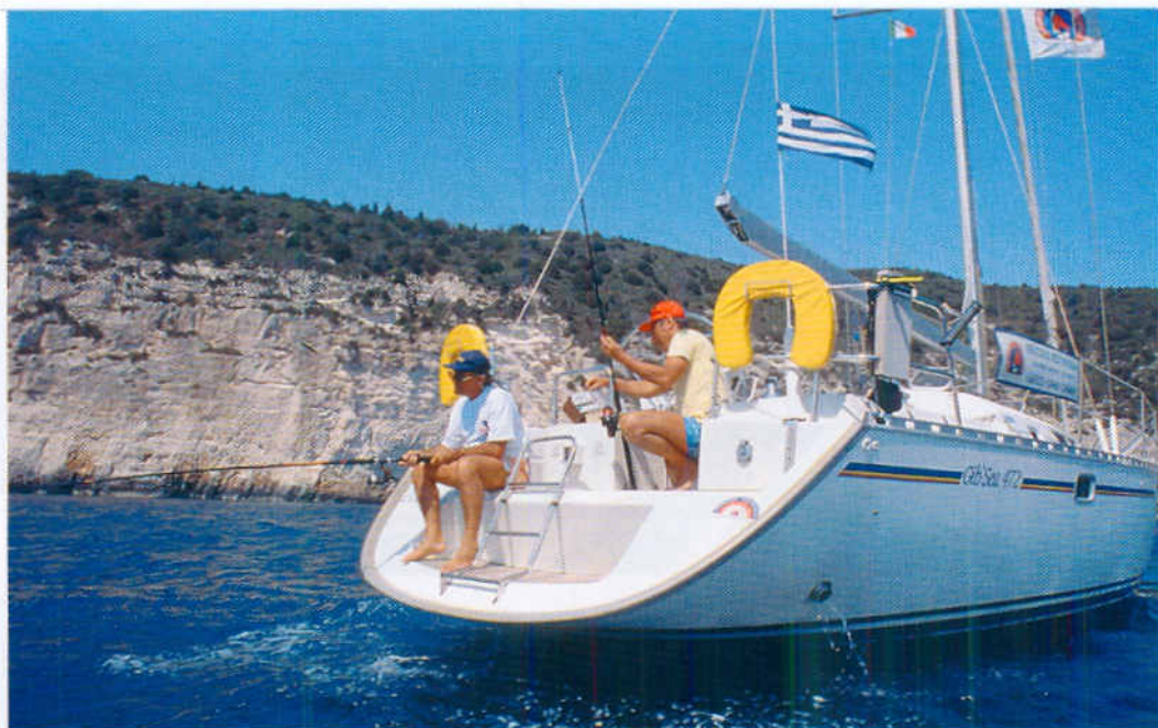
■ Panulavati se može i lakom priobalnom panulom

nema kapi vjetra, pa tada, da ne biste dangubili po bonaci - ili, još gore (i češće), po mrtvu moru - palite motor i plovite ekonomičnom brzinom krstarenja, nastojeći potrošiti što manje goriva. Ako pustite panule za brodom, onda ćete tu brzinu još smanjiti, držeći je na oko 4 čvora, iznimno do 7-8, te puštajući vaše mamce na dubinu od 40-50 metara. Budući da ćete, ploveći na motorni pogon, imati manje posla oko broda, možete baciti još jednu panulu - spuštajući je sa sredine krme, u brazdu, i to postavljajući omanjeg teturavca na pedesetak metara otpuštenog najlona. Naime, neke vrste ne samo da se ne plaše motora koji jednolično buči, nego se čak radoznalo približavaju propeleru, pa vam se može posrećiti da brzo zakvačite kakvu zlatoskušu ili drugu pučinsku ribu.