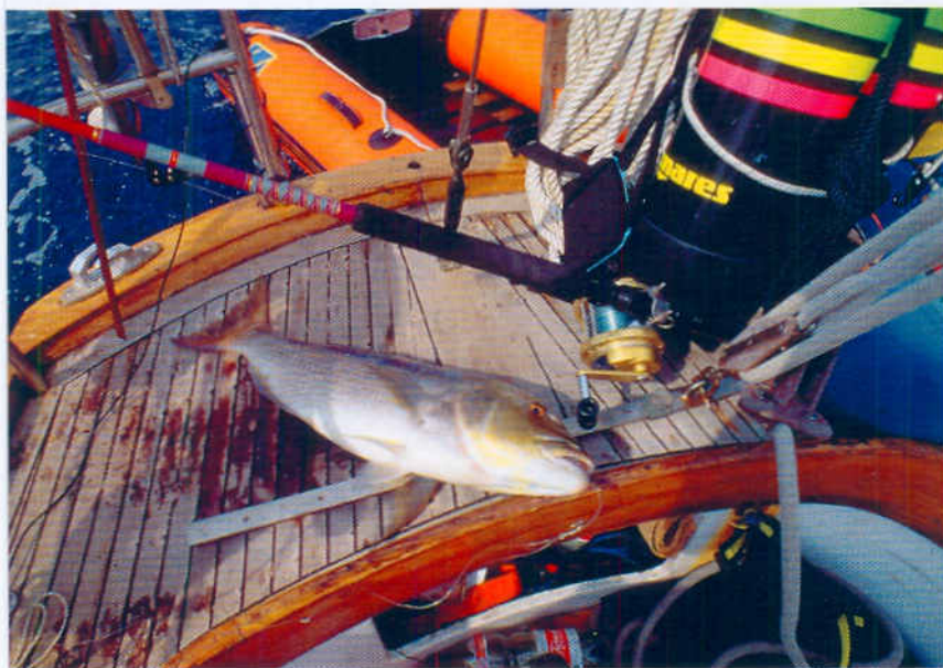
■ Zubatac je čest plijen iskusnih panulaša