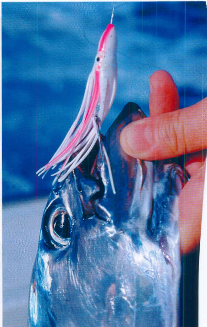
■ Lelujanje silikonskih rezanaca privlači i kapitalce

jedriličar, vodeći brod ustaljenom brzinom - idealnom za tu ribolovnu tehniku - ima, kartaškim rječnikom, asa više u ruci, budući da će ga ruta voditi i područjima kojima nitko ne baca parangale niti polaže mreže. Vremena ima napretek, ono uopće nije faktor u formuli ekonomije transverzalne plovidbe, a vučenje panule ne zahtijeva mijenjanje kursa - dok