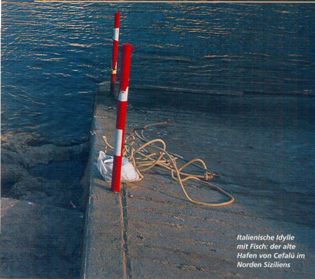
Italienische Idylle mit Fisch: der alte Hafen von Cefalù im Norden Siziliens

von Griechen, Römern, Arabern und Normannen aufgeblüht und wieder verwelkt. Ihre steinernen Zeitzeugen haben überlebt. Carl Viktor (Text und Fotos) über einen Törn rund um Sizilien zwischen Antike und Moderne