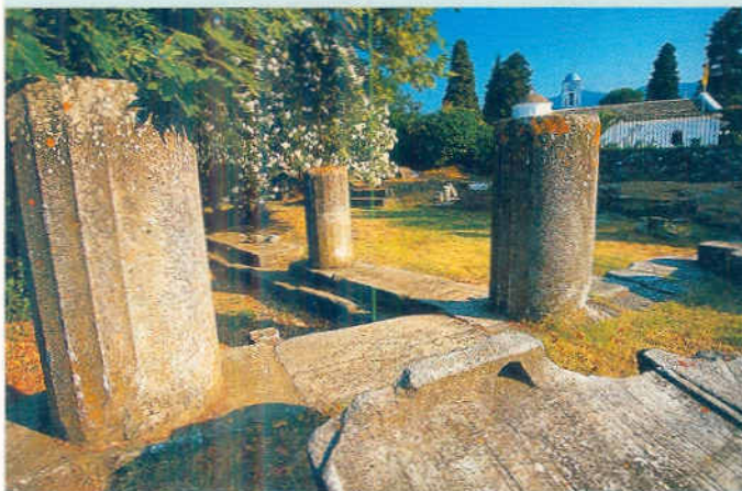
Auf den Spuren der Antike. Bis auf 3500 - 2600 vor Christus geht die Geschichte von Thasos zurück