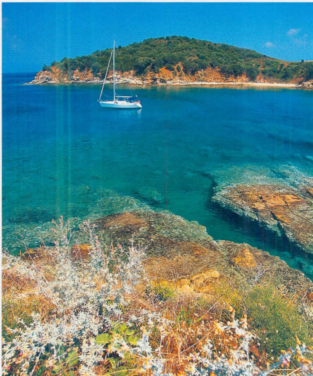
Einsame Ankerbuchten (hier Elevationis), farbenfroh schillerndes Wasser – die nördliche Ägäis lädt ein zu verträumten Badetagen

Wie oft habe ich schon eine Flaute verflucht – heute wäre ich froh darüber. Mit Kurs 350° zeigt der Kompass auf die Südspitze von Sithonia, den mittleren Finger von Chalkidike. Der Alte vom Meer meint es heute nicht so schlecht mit uns. Doch ganz ungeschoren lässt er uns auch nicht, und so rumst es kräftig, als wir mit voller PS-Stärke gegen den Meltemi angehen. Nach der Achterbahnfahrt geht es uns in Kouphou, dem Traumhafen an der Südwestspitze Sithonias, an diesem Abend nicht schlecht. Zwar spricht man hier nicht Deutsch und auch kaum Englisch, doch bekommen wir alles so, wie wir uns das vorgestellt haben. Hier brutzelt noch die Mutter meine gefüllten Kalamari, serviert werden sie von den Kindern und kassiert wird vom ältesten Sohn, der wegen seiner Englischfragmente den Oberkellner spielen darf. „Wo findst so was no?“, meint wohlgefällig ein Bayer und segelnder Griechen-