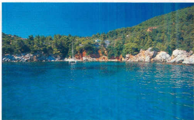
Nach dem Sohn der Götter Theseus und Ariadne benannt: die Bucht Staphylos auf Skopelos

seln wir bei einem Kaffee, ob vielleicht das Schmiedefeuher des hinkenden Gottes Hephaistos, der hier in Limnos seine Esse geschürt haben soll, nachdem er vom Olymp verbannt worden war, Schuld an dieser Hitze ist.