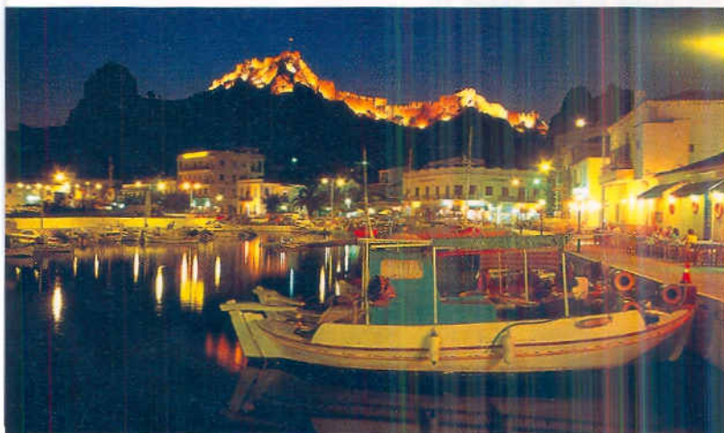
Quirige Hauptstadt und idyllischer Fischerhafen, mit dem Kastell im Hintergrund – Myrina auf Limnos

Vor gar nicht allzu langer Zeit gab man sich in der Ägäis griechischer als auf dem Festland. Mittlerweile haben viele Inseln, vom Massentourismus überrollt, ihre Identität verloren. Wer sich nach diesem „wie es einst war“ sehnt, sollte Kurs auf die nördliche Ägäis nehmen. Er wird dort in Fischerhäfen statt Marinas festmachen, mehr Klöster als Discos vorfinden und in so mancher Bucht als einziger Segler vor Anker liegen. Ein Bericht von Carl Victor