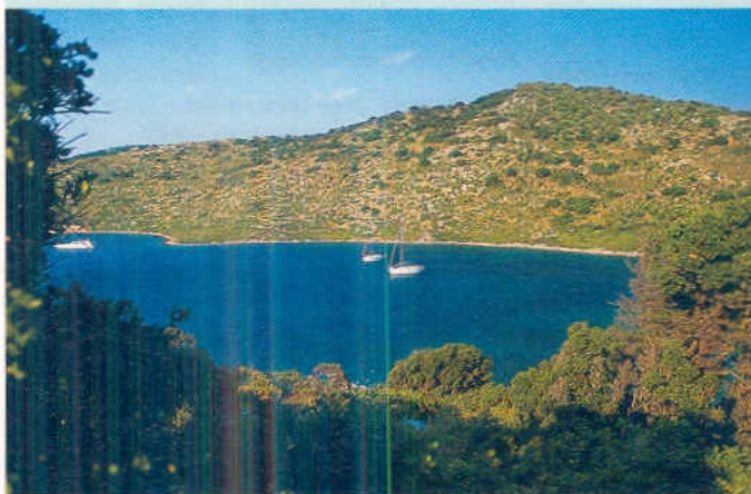
Vom Massentourismus verschont: Etwa 80 teilweise winzige Inseln gehören zu den Sporaden

einer Zirkusnummer mit artistischen Einlagen.