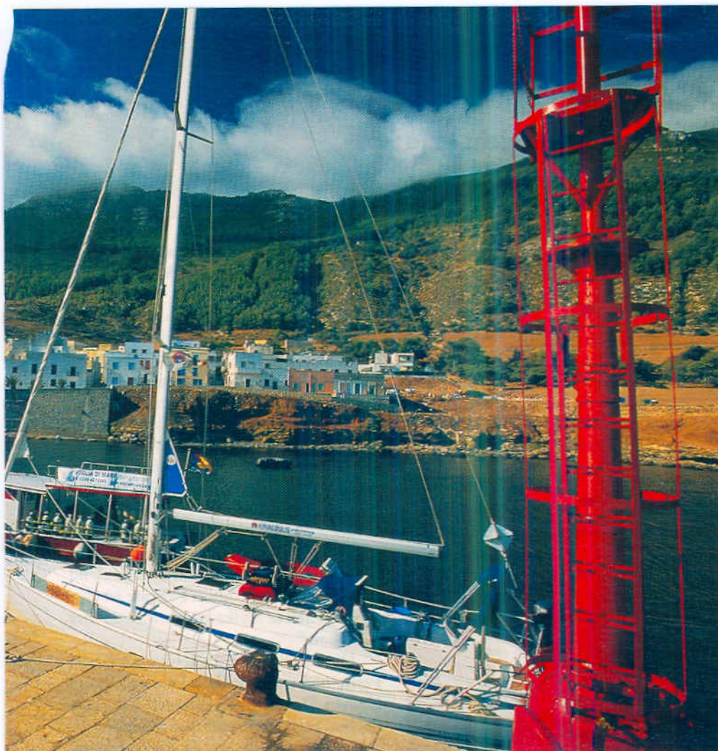
bietet Kaktusfrüchte zum Verkauf. Geschützt: eines der beiden Hafenbecken von Marettimo