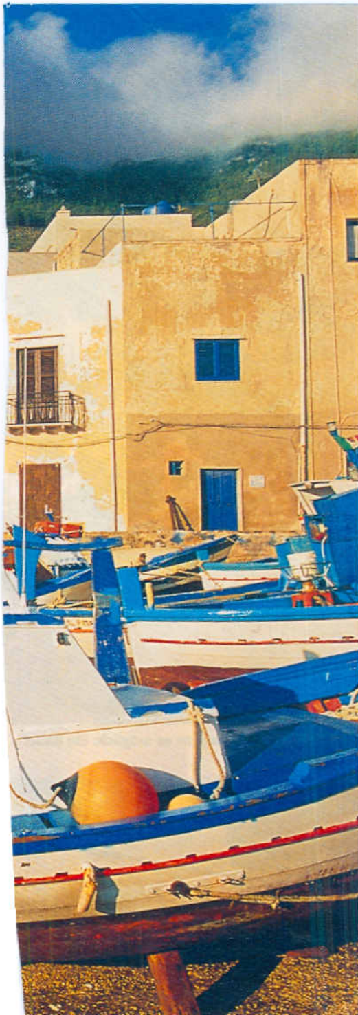
Der kleine Fischerhafen von Marettimo, der westlichsten der Egadischen Inseln (o.). Sehenswertes Schmuckstück: die Kirche auf der Hauptinsel Favignana