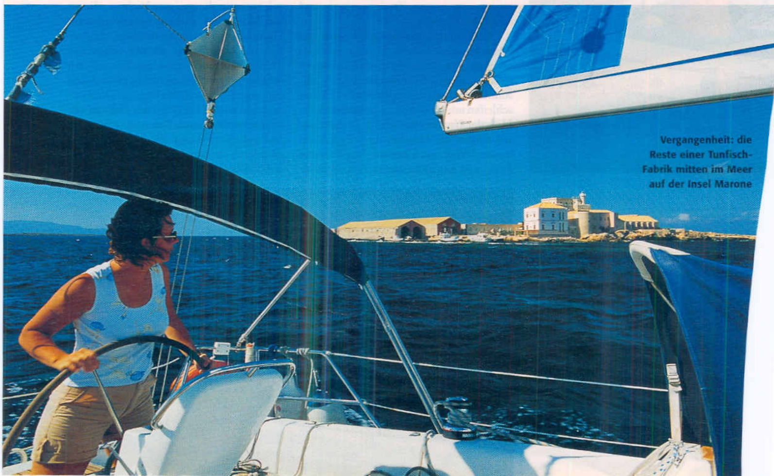
Vergangenheit: die Reste einer Tunfisch-Fabrik mitten im Meer auf der Insel Marone