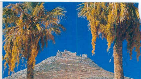
Alt und attraktiv: Ruine auf Favignana (o.), die Gassen von Castellamare del Golfo

Am nächsten Morgen steht die Rückreise an. Ein Kurswechsel nicht allein deshalb, weil es nun, wunderbar geschoben vom achterlichen Nordwestwind, der aufgehenden Sonne entgegen geht. Der Bug weist wieder in Richtung Chaos – nach Palermo. Und im Kielwasser bleibt ein kleines, vergessenes Inselparadies zurück, das geduldig und bescheiden auf Entdecker wartet.