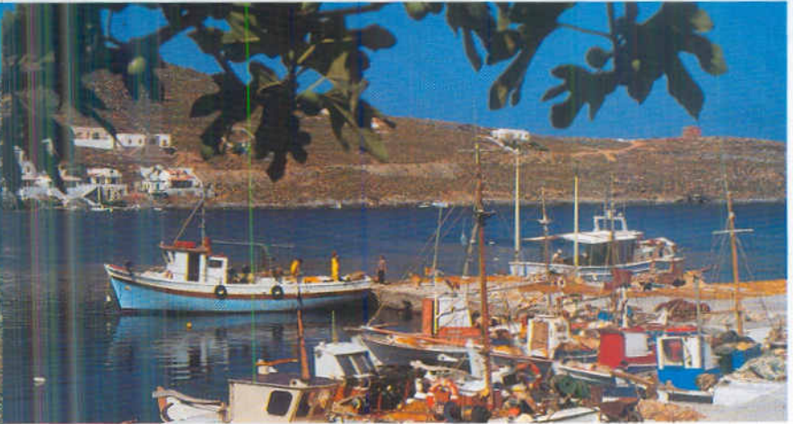
Nella pagina a fronte, il magnifico ridosso di Astipalea. A sinistra e sopra, le acque trasparenti di Amorgos e Kithinos, basi di flotte pescherecce.