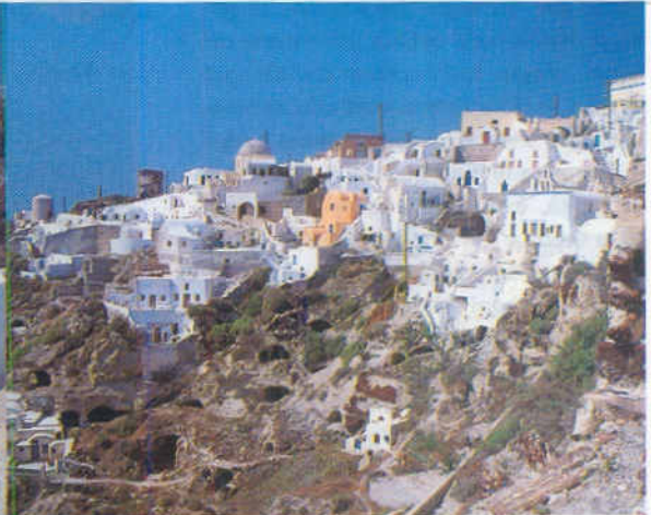
Sopra: due immagini dell'abitato e dell'isola di Santorini, un vulcano che nel lontano passato esplose provocando un immenso disastro, anche con onde di tsunami, nel Mediterraneo orientale. In basso, pescatori di Mikonos.