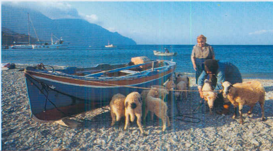
Nell'apertura, una delle numerose piccole baie di Milos, nelle Cicladi, dove la mitologia greca colloca la nascita, fra le spume del mare, di Venere la bellissima. Qui, immagini di Olympos e del porticciolo di Rodi.

monio regalati al passato) mi hanno lasciato in eredità una buona padronanza della lingua greca e un amico titolare della più importante agenzia di charter del paese: la Kiriakoulis Mediterranean. E niente meglio di una barca e della possibilità di parlare con la gente può aprirti le porte di un Paese che da sempre ha costruito la sua storia sul mare. La Grecia come immenso arcipelago, la vera polinesia, come recitano le origini etimologiche di questa parola, è per noi a un passo e vale la pena di scoprirla proprio attraverso le sue isole. Magari con una barca in charter, quel charter che qui è attività primaria per la nautica a motore e a vela. E poiché parlare di tremila isole potrebbe essere dispersivo, questa ▶