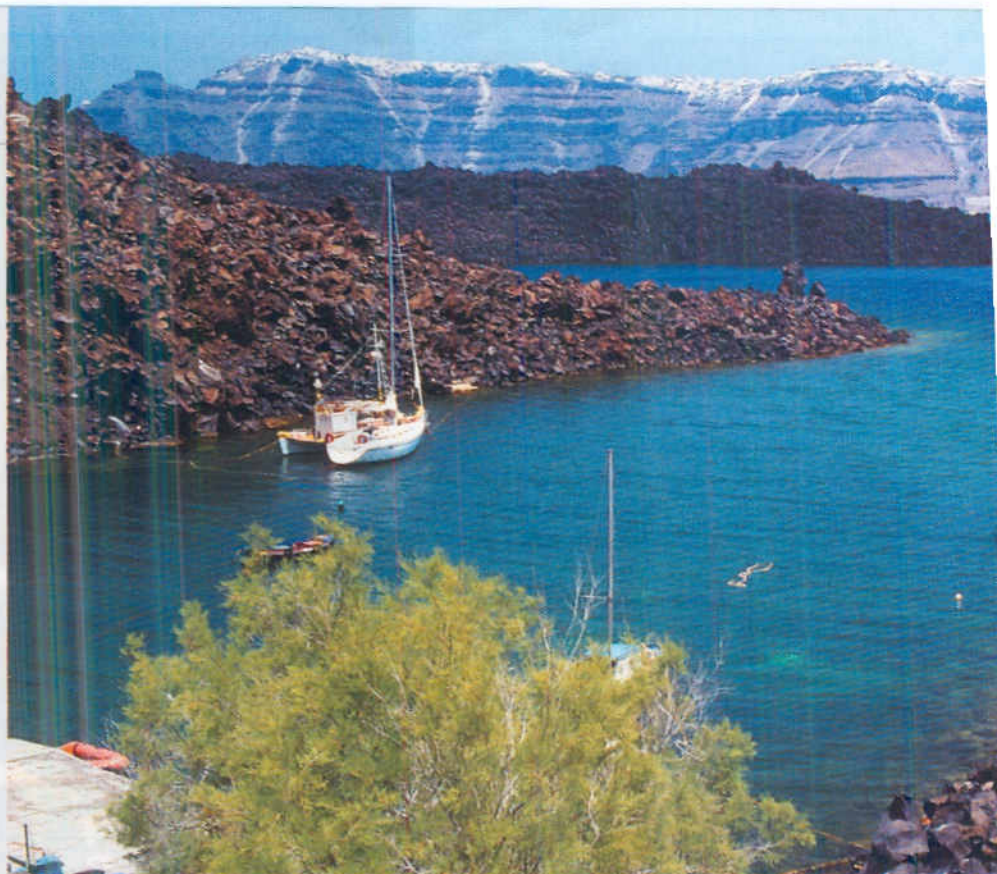
Sopra e in alto a destra, un fantastico ridosso lungo le tormentate coste e le pareti strapiombanti della "caldera" dell'isola di Santorini. Sempre a destra, in basso, immagini colte sull'isola di Rodi.

Più a nord l'isola di Kalymnos, antica e ancora attiva capitale delle spugne, conserva le tradizioni di un mestiere pericoloso e affascinante. Ancor oggi gli ultimi spugnari preferiscono un narghilé e un compressore a bassa pressione, che consente loro lunga autonomia, ai moderni