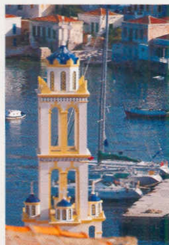
Chalkis Hafen mit der Kirche Agios Nikolaos

Karpathos liegt im Süden, und genau aus dieser Richtung