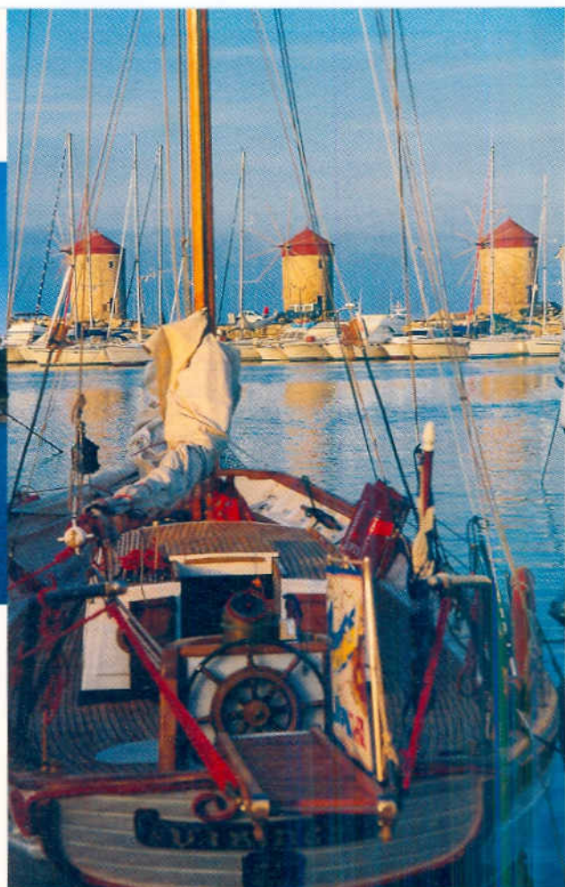
Im Mandraki-Hafen von Rhodos – hier lassen sich alle Versorgungsmöglichkeiten finden

kommt am nächsten Tag der Wind. Wir gehen auf Steuerbordbug hart an den Wind, doch dieser Schlag bringt uns nur bis Diafani. Es wäre verlockend, den Hafen anzulaufen. Karpathos ist eine traditionsbewusste Insel, und nirgendwo sonst werden die alten Bräuche noch so gepflegt wie im Dorf Olybos, in den Bergen hoch über Diafani. Die Handbücher schweigen sich leider über diesen Fährhafen aus. So entscheiden wir uns für Pigadia. Dort genießen wir das Privileg, als einzige Yacht am Kai zu liegen, eine Offenbarung ist die Inselhauptstadt aber nicht. Ohne geschichtlichen Hintergrund, bar aller Kulturdenkmäler hat sie sich ganz dem Tourismus verschrieben.