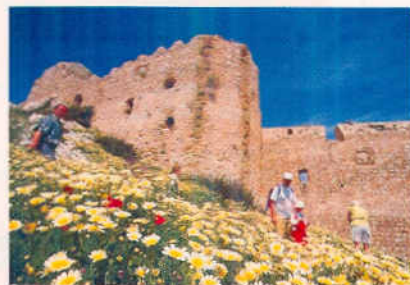
Frühling auf Rhodos – Blumen und Wälle prägen das Stadtbild

Kiriacoulis gibt eine gute Wetterinformation in Rhodos. Handy nicht vergessen. Gut zu empfangen mit mobilem Kurzwellenempfänger Wetterberichte der Deutschen Welle auf 9.545 und 13.780 kHz um ca 1750 MESZ und von