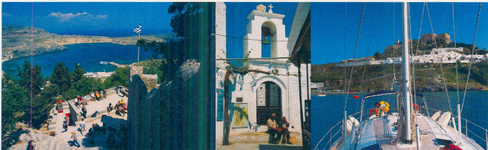
Lindos auf Rhodos – Scharen von Touristen bewundern täglich auf der Akropolis die Aussicht über das Meer