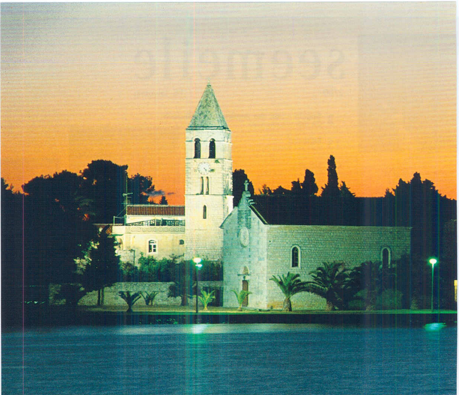
Vis, Hafen und Franziskanerkloster auf der Halbinsel Pirovo.