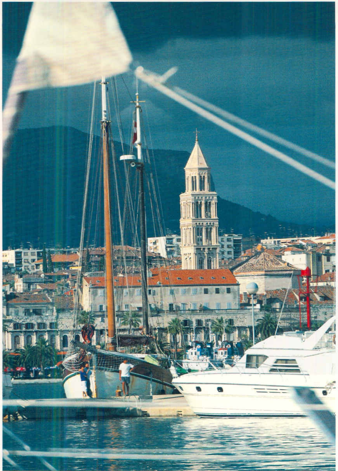
Hvar, Hafen und Turm der Klosterkirche San Marco.

Die Landschaft besticht nicht durch Schönheit, die Küche lockt nicht mit Gaumenfreuden; die Preise schrecken viele ab. Für die kleinen Misslichkeiten entschädigt wird der Besucher durch kulturelle Höhepunkte. Griechen, Römer, Byzantiner,