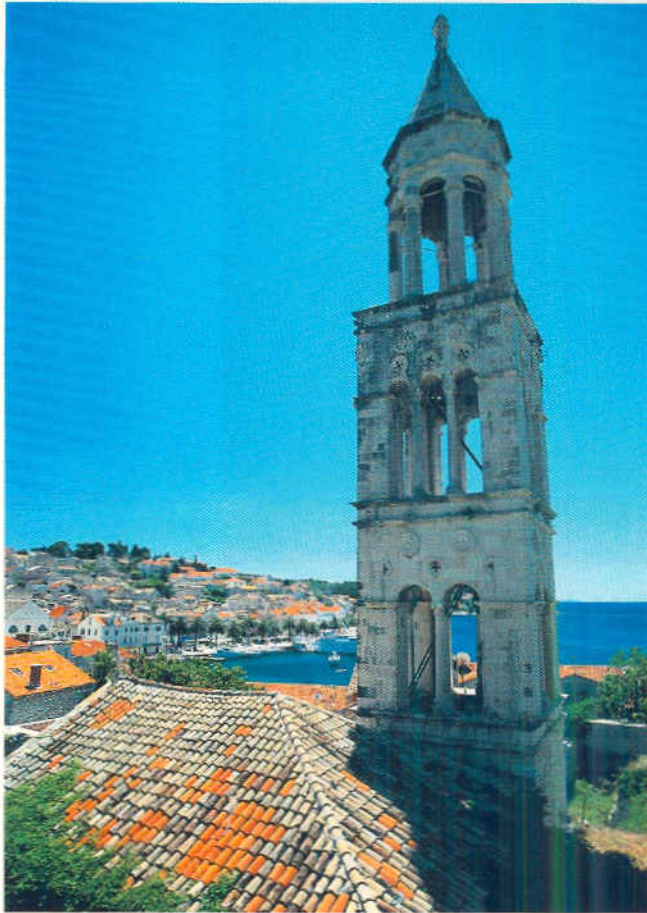
Hvar, Hafen und Turm der Klosterkirche San Marco.