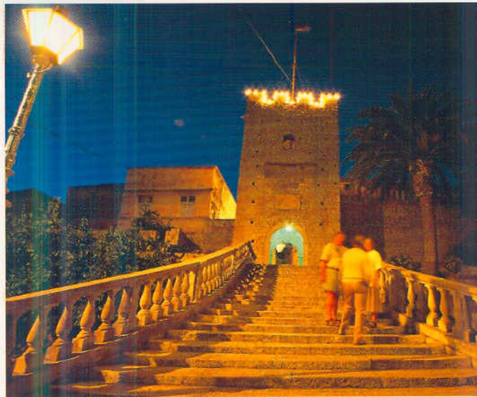
Korčula, Turm Veliki, Revelin mit Barockstiege.

Den Restaurants sind beim Kampf um die wenigen Touristen alle Mittel recht. «Gehen