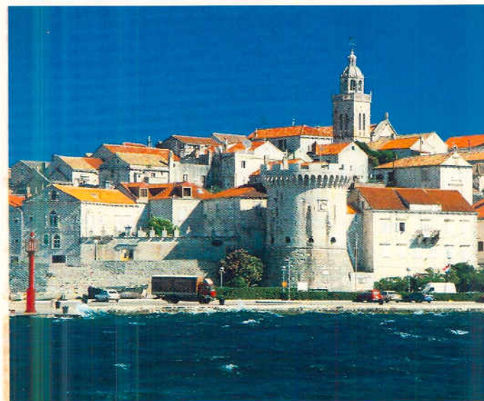
Korčula, Altstadt und der bei Nordwind unruhige Hafen.