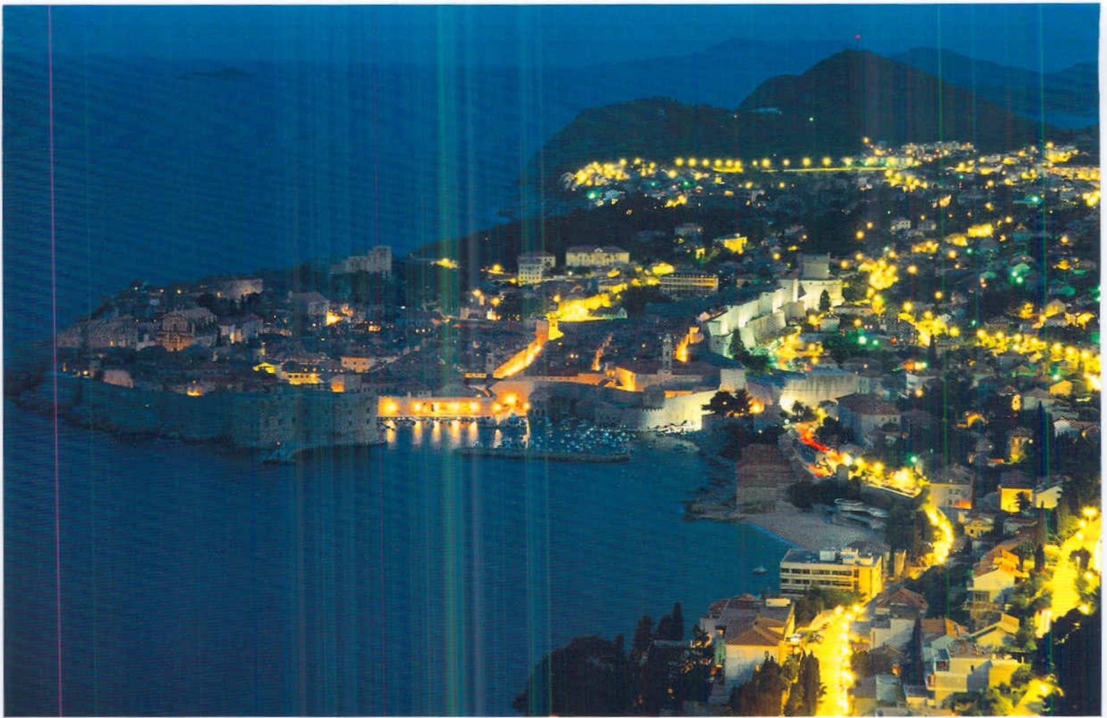
Nächtlicher Blick von der Küstenstrasse auf Dubrovnik.