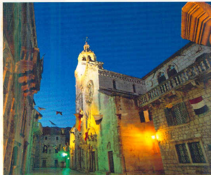
Korčula, Domplatz mit Markuskathedrale, Bischofspalast und Rathaus.