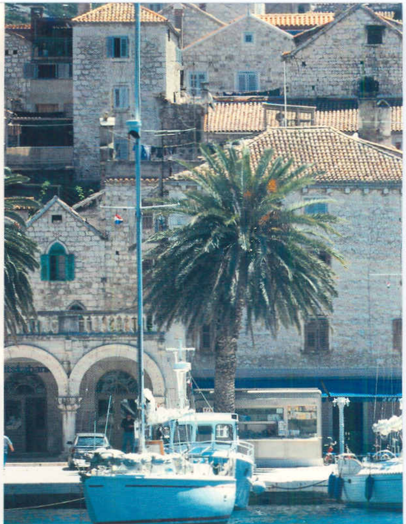
Hvar, Hafen und Altstadt.

Sie bloss nicht zu dem an der Ecke, der kocht schlecht», schwärzt einer seinen Konkurrenten an. – Dubrovnik, das alte Ragusa, gilt auch als eine der Perlen der Adria. Wer den steilen Aufstieg zur Küstenstrasse nicht scheut, wird mit einem Blick auf das zu seinen Füßen schimmernde Kleinod belohnt, von dem George Bernard Shaw als vom Paradies auf Erden schwärmte.