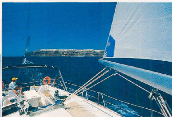
Die Bavvaria 50 verlässt Santorin über die Nordeinfahrt mit la

weißen Häusern der Chora sind uns eine gute Landmarke beim Ansteuern des Hafens Skala. Auch in Patmos hat man die Yachten verlegt. Und doch ist Skala nicht wie Kos. Trotz des Touristenrummels hat es sich viel von seiner Stille bewahrt. Immer noch rattert ein Bus hinauf zur Chora unter den Zinnen des Johannesklosters. Wenn gerade kein Kreuzfahrtschiff im Hafen liegt, lohnt sich ein Streifzug durch die Säulengänge und mystischen, im Schein flackernder Kerzen vom Weihrauch eingenebelten Grotten des Klosters.