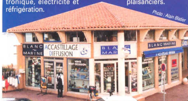
Blanc Marine, Zone technique, 83600 Port-Fréjus Tél. 04.94.52.21.46 - Fax 04.94.52.34.69