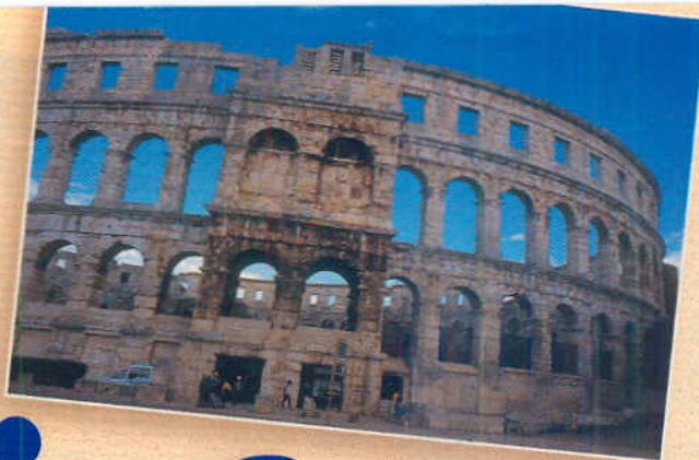
Het amfitheater van Pula.