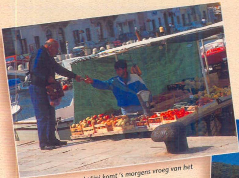
De groenteboot van Lošinj komt 's morgens vroeg van het vasteland naar de haven.

Zeven vrouwen op het grootste jacht van de vloot. We zijn nu al een bezienswaardigheid