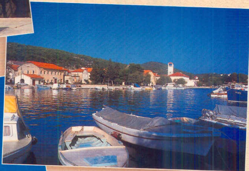
Een gedeelte van de haven van Iz is ondiep, maar zelfs met onze 46-voeter kunnen we nog aan de kade, niet dwars natuurlijk, alleen met kop of kont naar de wal.

Zeven vrouwen op het grootste jacht van de vloot. We zijn nu al een bezienswaardigheid