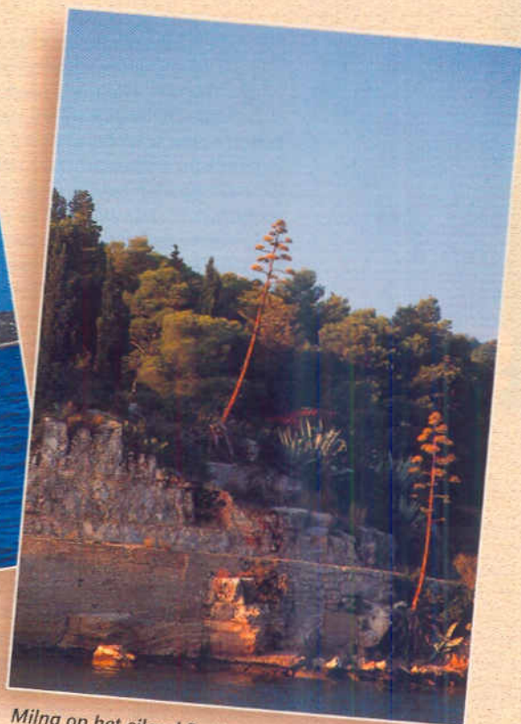
Milna op het eiland Brač is een verrassing. De oh's en ah's zijn niet van de lucht.