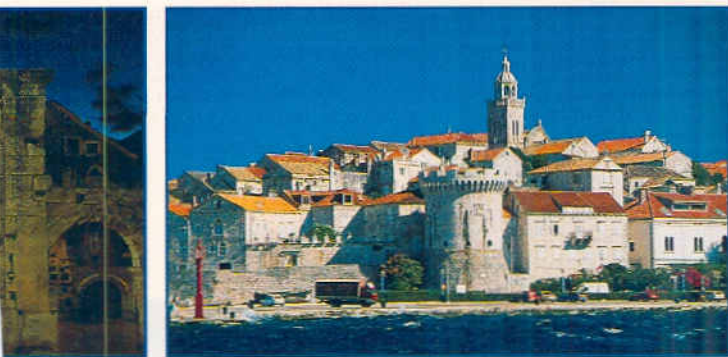
Korcula: bei Nordwind wird's im Nordhafen unruhig