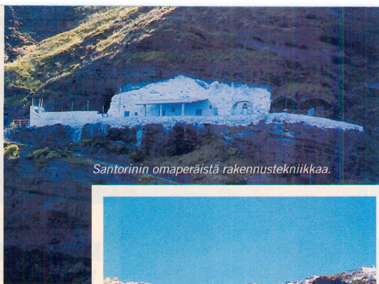
Santorinin omaperäistä rakennustekniikkaa.