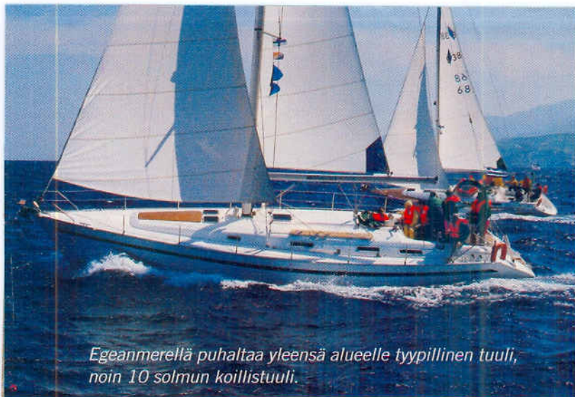
Egeanmerellä puhaltaa yleensä alueelle tyypillinen tuuli, noin 10 solmun koillistuuli.