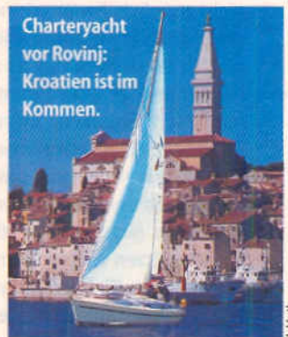
Charteryacht vor Rovinj: Kroatien ist im Kommen.

► Der Chartermarkt in Kroatien gewinnt nach dem Krieg immer mehr an Bedeutung. Rechtzeitig zu Beginn der Osterferien in Bayern in der zweiten Aprilwoche will der Charter-Riese Moorings (bei verschiedenen Agenturen buchbar, achten Sie auf den Moorings-Schriftzug) am neuen Stützpunkt in Pula die ersten Schiffe bereitstellen. Die Flotte besteht aus Bénéteau- und Jeanneau-Yachten zwischen 36 und 52 Fuß. Wer's besonders rasant mag, sollte sich