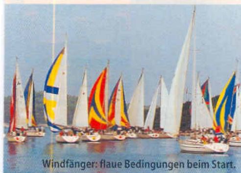
Windfänger: flauere Bedingungen beim Start.

Charter-Regatten mit Programm – fast jede für sich ist eine kleine Erfolgsgeschichte. So auch für AMS-Charter. Im vierten Jahr kamen 150 Segler auf 23 Yachten zusammen, die fünf Wettfahrten auf der Adria absolvierten. Für die nächste Veranstaltung vom 26. September bis 3. Oktober 1998 sind schon 18 Yachten vermietet. Sie führt von Porec nach Zadar und zu-