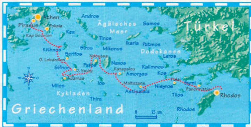
One-way durch die Ägäis bedeutet einen Törn von 500 Meilen in 14 Tagen.

Jachten trifft, kommen wir uns hier vor wie auf einem überfüllten Campingplatz, wenn 20 Schiffe dicht an dicht an einer winzigen Betonpier liegen. Das Anlegen erfolgt rückwärts mit Buganker und Heckkleinen, wobei uns immer genügend Nachbarn beim Festmachen behilflich sind. Auch die Sprache ist hier Griechenland-typisch und kein Problem: Neben der Flagge des Heimathafens am Heck gehört es zum guten Ton bei den Charterjachten, die Nationalität der Crew durch eine Flagge unter der Backbordsa-