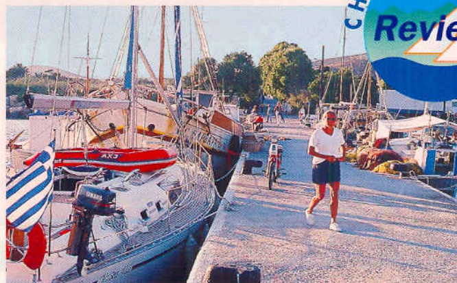
In der Mitte der Ägäis sind wir fast allein. Auf Astipalaia ist genug Platz, um zwischen den Fischerbooten längs zu liegen.

steil steigt der Grund zum Ufer hin an? Fahren Sie langsam mit dem Bug voraus Richtung Land. Ein Mann hält Ausschau und warnt rechtzeitig. Gleichzeitig muß ständig gelotet werden. Dann ist es Zeit, das Dingi klarzu-