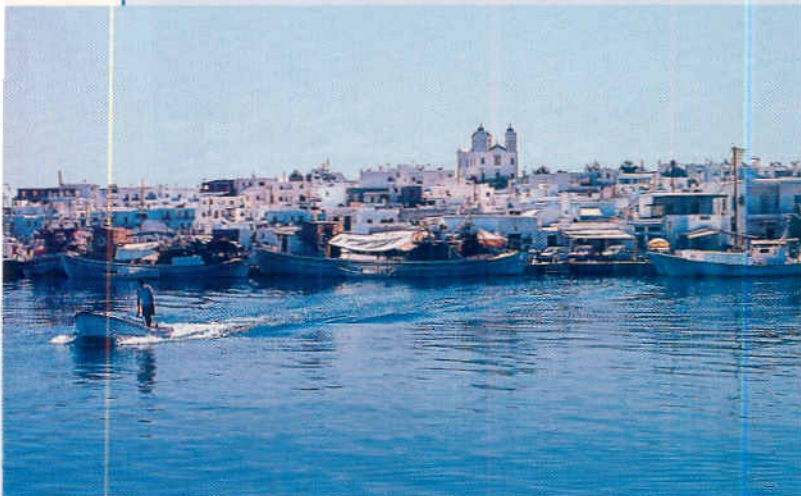
In den Inselhäfen hat man Gelegenheit, Proviant aufzustocken.

Das Segeln in der Ägäis ist durch die vorherrschenden Nordwinde sehr kalkulierbar. Sie wehen in den Sommermonaten sehr stark und legen unter hohen Inseln noch einmal kräftig zu. Auslaufen kann man daher auch bei Starkwind, denn draußen ist es meist friedlicher. Im Gegensatz zu anderen Revieren fehlt es hier jedoch fast vollständig an ausgebauten Hafenanlagen. Übernachtet wird entweder an der Pier oder vor Anker.