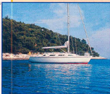
Mit Landfesten spart man Platz in engen Ankerbuchten.

steil steigt der Grund zum Ufer hin an? Fahren Sie langsam mit dem Bug voraus Richtung Land. Ein Mann hält Ausschau und warnt rechtzeitig. Gleichzeitig muß ständig gelotet werden. Dann ist es Zeit, das Dingi klarzu-