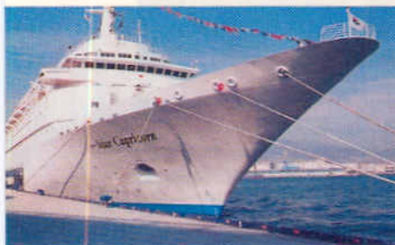
La SuperStar Capricorn a Taiwan.

Si chiama SuperStar Capricorn , la nuova nave da crociera entrata a far parte della flotta asiatica Star Cruises e che effettuerà crociere nelle acque di Taiwan e Giappone. Varata in marzo, la nave è particolarmente indicata per crociere di gruppi di famiglie che possono trovare a bordo un'atmosfera top-class e un pro-